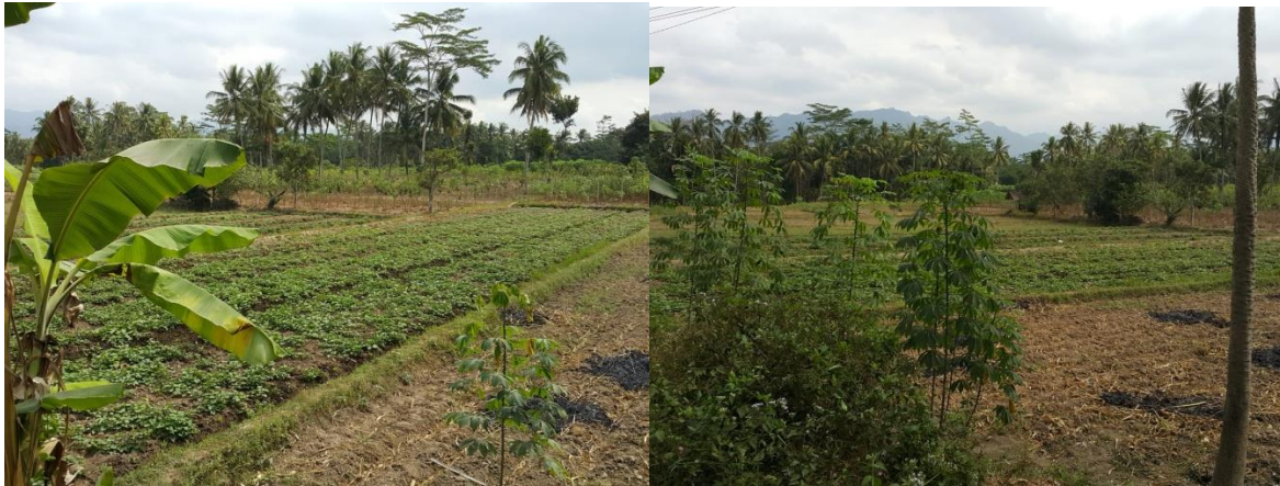
FOTO KAWASAN SEKITAR