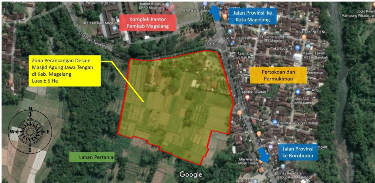
Foto Citra Lokasi Perencanaan

Download file area perencanaan (*.kmz) di Google Earth: http://bit.ly/386MJgR